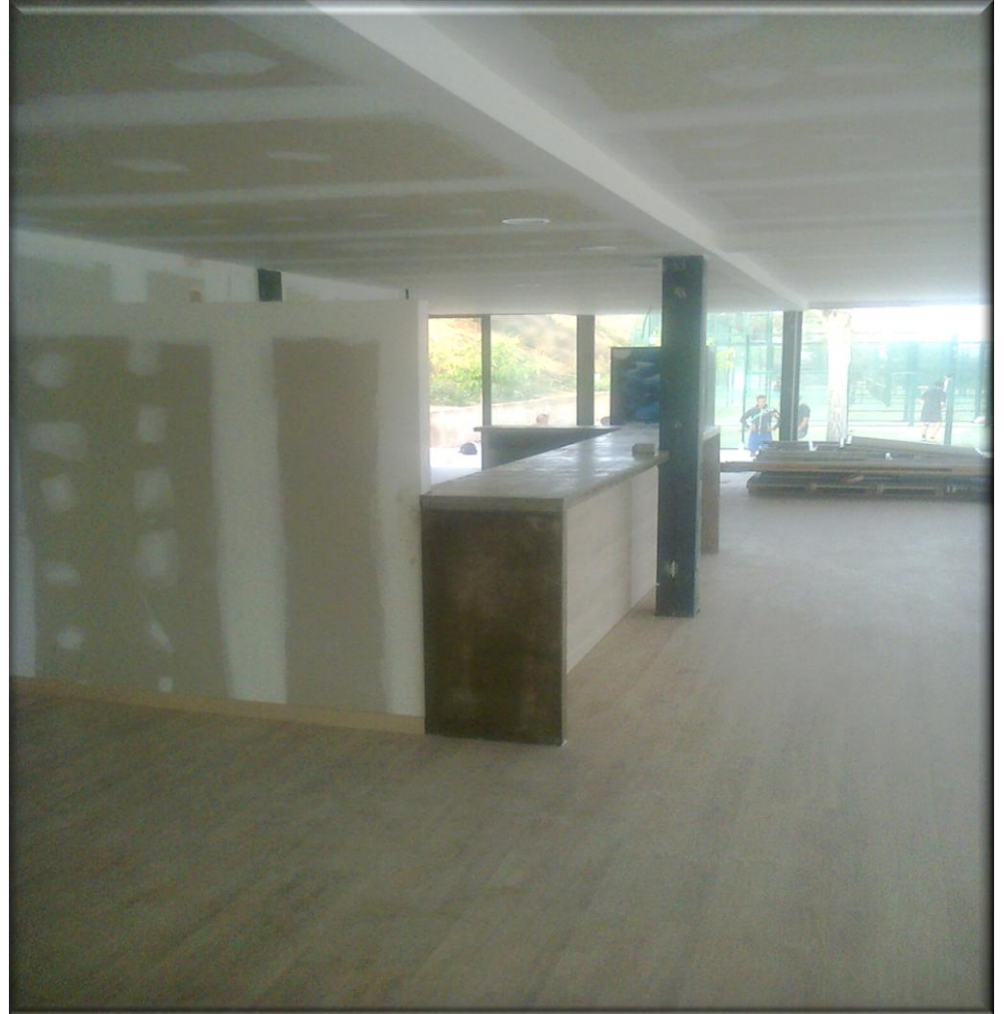
Barra de formigó durant el muntatge